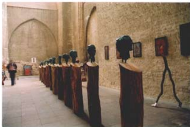
Ausstellung „Apostelköpfe in der Marienkirche“, 1998, Stralsund